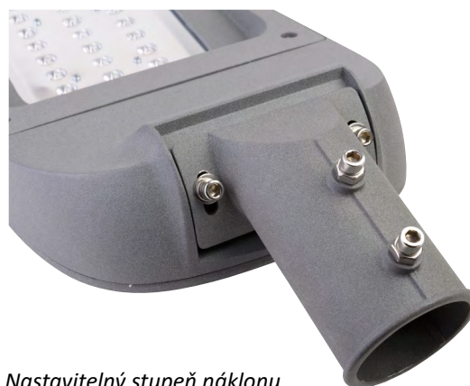
Nastavitelný stupeň náklonu