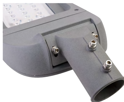
Nastavitelný stupeň náklonu