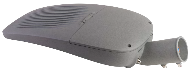
Das Netzteil ist vom LED Modul abgetrennt