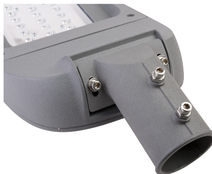
Nastavitelný stupeň náklonu